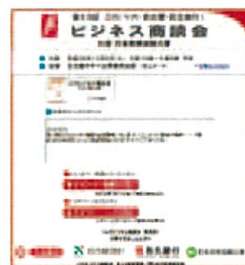
ホームページ イメージ